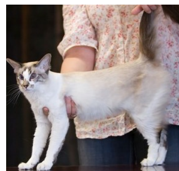
Seychellois Langhaar ©*2

weiß, nur der Schwanz ist farbig und einige kleinere Stellen am Kopf. Seychellois Huitième ist in allen Farben vertreten, meist sind sie aber weiß, wo bei nur der Schwanz, einige Stellen am Kopf und an den Beinen mit Tupfen gefärbt sind. Seychellois Septième hat kaum noch etwas von der weißen Grundfärbung und zeigt sich in allen Farbvarianten der Rasse.